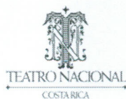
CUADRO N°1.1 TEATRO NACIONAL DE COSTA RICA DETALLE DE EVENTOS TEATRO AL MEDIODIA POR NOMBRE EVENTO, CANTIDAD, FUNCIONES, ASISTENCIA SEGÚN FECHA AL 31 DE DICIEMBRE DEL 2013 (absolutos y relativos)